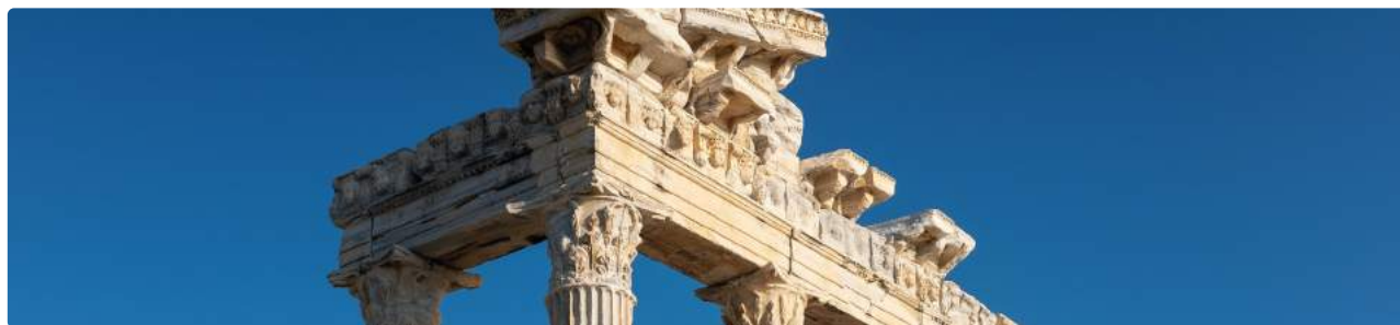
Side Antik Kent