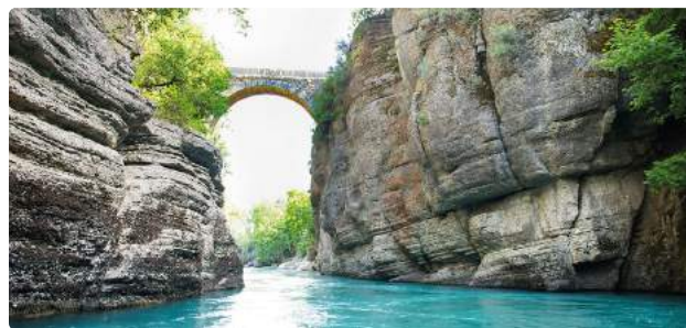
Manavgat - KöprülÜ Kanyon