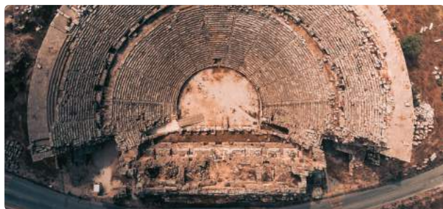
Aspendos Antik Tiyatro

Кредитные карты : Visa, Master Card Домашние Напряжение животные : Не принимается Voltaj : 220 v Раздел для некурящих : в закрытых помещениях (номера, вестибюль, ресторан, лифт и т.п.) в гостиничных заведениях. Смена банных и пляжных полотенец : Это делается каждый день. Смена постельного белья : Это делается каждые два дня.